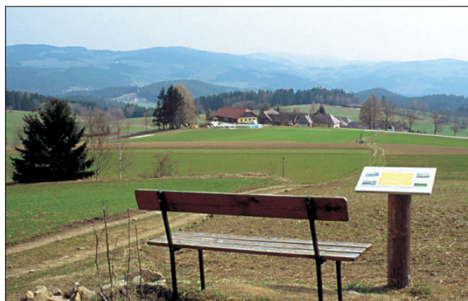
Ein Bankerl lädt am Panoramaplatz zum Schauen und Verweilen ein.

mische Panorama vereint. Mit prachtvollen Ausblicken über den gesamten Bezirk Rohrbach geht es gemütlich bergab zum ehemaligen Gasthof Winkler (Station 15). Kurzer Asphaltmarsch, dann rechts auf Saumweg einem Graben zu. Der Weg wird schmaler, romantischer. „Nach einer Weile war es, als rauschte es irgendwo unten... Das Rauschen tönte näher, aber es war nur Wasser, das den Wald eher schauerlicher machte...“. Mit diesen Zeilen aus Stifters „Waldsteig“ gelangen wir zur letzten Station am Pürwaldbach, von der wir Mayr's Wirtshaus (MO + DI gesperrt, großer Kinderspielplatz, schöner Gastgarten, vorzügliche Küche) in wenigen Minuten erreichen.